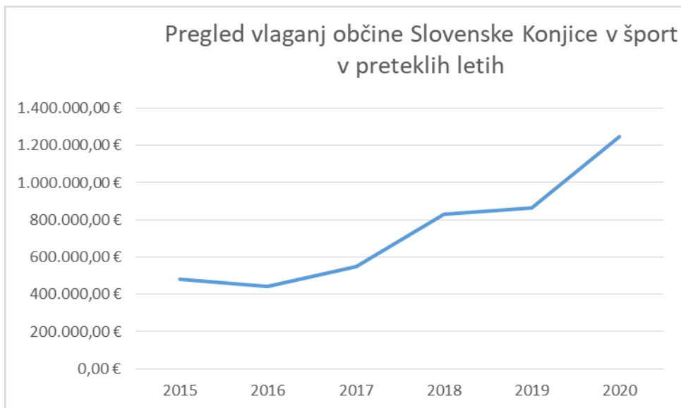
Graf 3: Pregled vlaganj Občine Slovenske Konjice v šport v preteklih letih

Podatki iz analize kažejo, da se višina sredstev, namenjenih vzdrževanju oziroma novim športnim površinam v občini Slovenske Konjice z leti viša (finančno in odstotkovno glede na višino celotnega proračuna), kar je za razvoj športa spodbudno; posledično pa dobri pogoji za delo omogočajo tudi razvoj društev, programov ter števila vključenih.